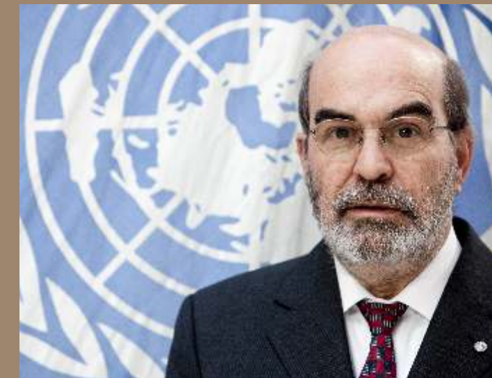
JOSÉ GRAZIANO DA SILVA Director General de la FAO

En este sentido, celebrar la quinua no es sólo celebrar un alimento sino a toda la cultura e historia de los pueblos originarios andinos y a los miles de campesinos y agricultores familiares –tanto mujeres como hombres– que por siglos han preservado y cultivado un alimento único para las generaciones presentes y futuras. Esta es la verdadera riqueza que nos ofrece la quinua: un futuro sembrado hace miles de años.